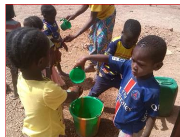
lavage des mains