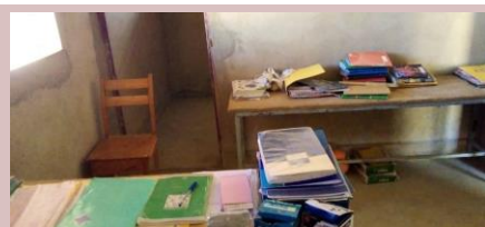
Intérieur d'un bureau

Pour compenser la fermeture du collège l'an dernier lors du confinement, les élèves de 3eme ont eu leur scolarité rallongée d'un mois de plus. Il a donc fallu payer enseignants et surveillants en plus. Nous avons envoyé 1 200€ pour participer aux salaires.