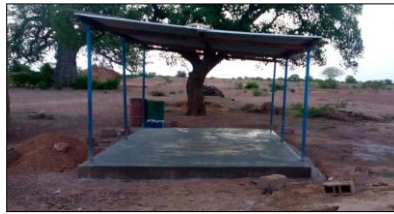
La chappe se fait sous le hangar qui avait servi de "classe" au début!

Une nouvelle demande m'a été faite: utiliser la salle de classe pour de l'alphabétisation. Les mamans veulent apprendre à lire et à écrire le français ( la plupart parlent en mooré). Elles se sont adressées à un papa qui saurait les aider. Je suis, bien sûr d'accord pour ce projet. La question de l'électricité va se poser puisqu'elles viendraient en fin de journée et la nuit arrive à 18H. Les parents d'élèves doivent se réunir début juillet pour discuter de tout ça. Suite au prochain numéro et merci encore du fond du coeur pour vos dons qui vous le voyez aident grandement ces petits projets