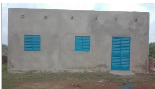
petite " école"