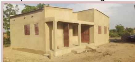
Bâtiment administratif crépi...

La construction du bâtiment administratif ainsi que des toilettes pour les enseignants est terminée. Nous avons pu envoyer une aide de 1 050 € pour la toiture. Maintenant, ces bureaux sont bien utilisés. Le directeur peut recevoir les parents en toute discrétion, ils ont une petite "cuisine" leur permettant de manger à la coupure de midi.