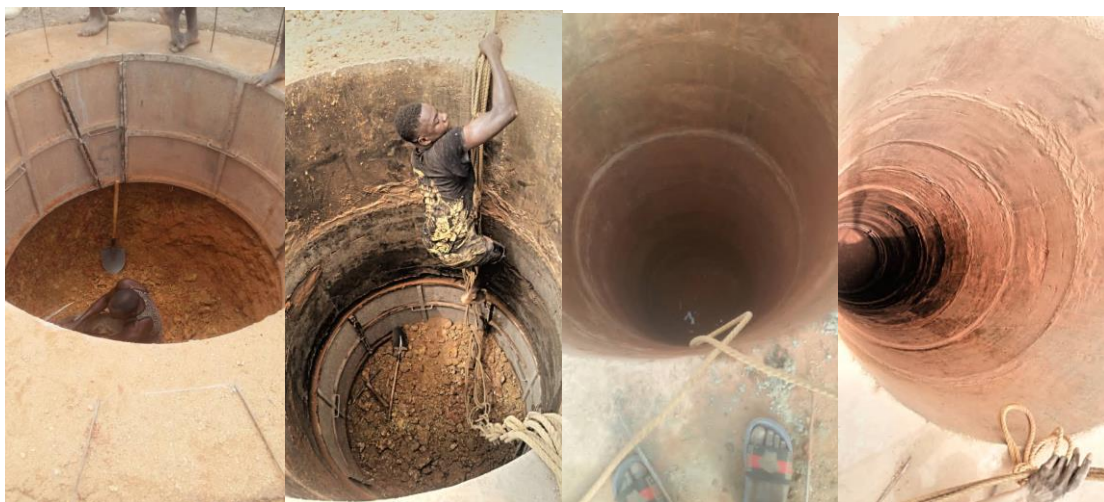
Avancées des travaux entre février et avril 2021.