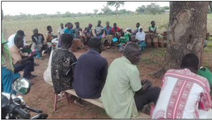
réunion des parents d'élèves