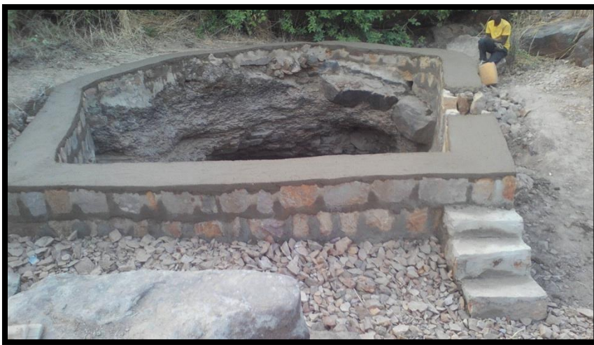
Réservoir d'eau d'Arou.

Le réservoir d'eau de pluie d'Arou est opérationnel. Il s'est rempli pendant la saison des pluies cet été. L'expérience de cette année permettra de savoir si cela correspond bien aux besoins du village ou si nous devons adapter certaines choses.