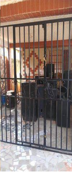
Local du matériel sono

Aide aux devoirs : Depuis janvier 2016 il y a eu 12 enfants qui ont bénéficié de cette aide 3 fois deux heures par semaine. Nous allons organiser cette activité pour 24 enfants : 3 heures / semaine pour chaque groupe de 12 enfants.