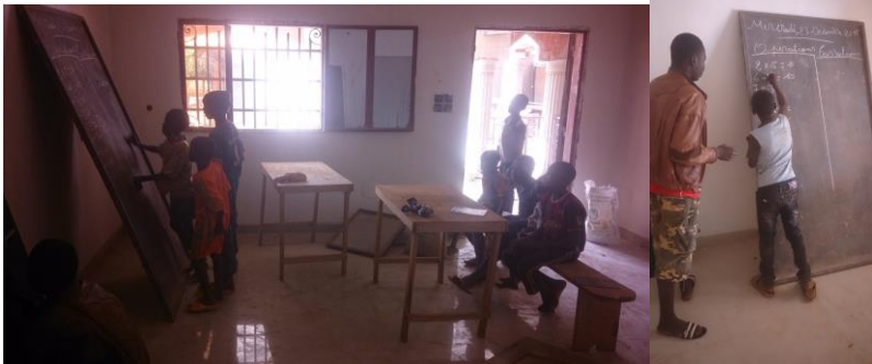
Aide aux devoirs

Un jeune niveau BAC en assure le fonctionnement depuis le mois de janvier. Les enfants peuvent aussi venir faire leurs devoirs mais s'en être aidés.