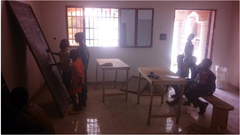
Les enfants viennent également pour jouer.