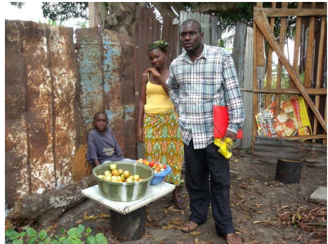
Récolte d'aubergines (la plus grosse au dessus du seau fait 800 gr !), de tomates et de gombos

Le livret de caisse d'épargne, ouvert en même temps que le projet (micro financement pour frais d'exploitation et d'investissements futurs)