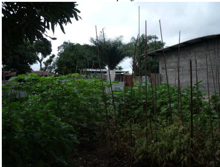
Vues internes et externe (palissade)